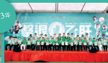
2013年7月28日 銅鑼灣維園