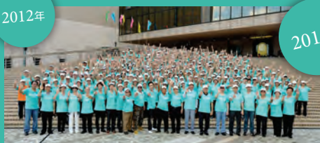
2012年7月28日 尖沙咀文化中心