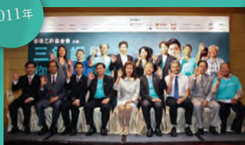
2011年7月28日 帝京酒店記者招待會