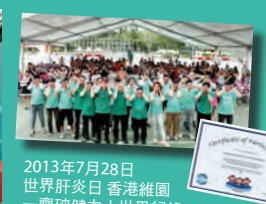
2013年7月28日 世界肝炎日 香港維園 一齊破健力士世界紀錄